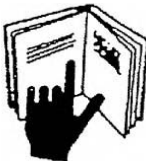
Simbolul pentru precauțiile particulare de utilizare

*) Anexa nr. 3 este reprodusă în facsimil.